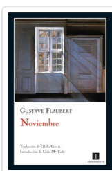
NOVIEMBRE FLAUBERT, GUSTAVE