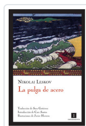
PULGA DE ACERO LESKOV, NIKOLA