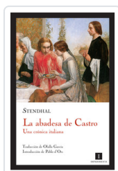
ABADESA DE CASTRO STENDHAL