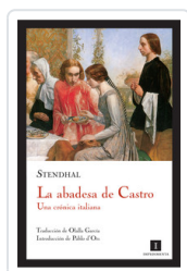
ABADESA DE CASTRO STENDHAL