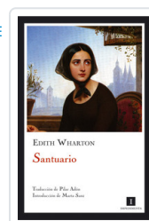
SANTUARIO WHARTON, EDITH