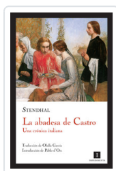
ABADESA DE CASTRO STENDHAL