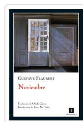
NOVIEMBRE FLAUBERT, GUSTAVE