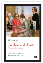
ABADESA DE CASTRO STENDHAL