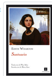
SANTUARIO WHARTON, EDITH