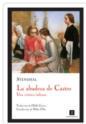
ABADESA DE CASTRO STENDHAL