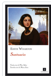
SANTUARIO WHARTON, EDITH