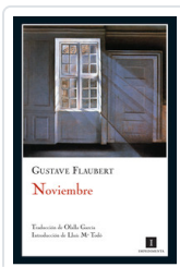
NOVIEMBRE FLAUBERT, GUSTAVE