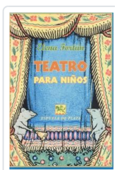
TEATRO PARA NIÑOS FORTUN, ELENA