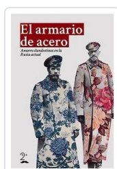
ARMARIO DE ACERO, EL AA.VV