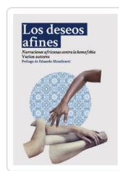
DESEOS AFINES, LOS AA.VV