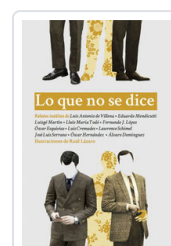
LO QUE NO SE DICE AA.VV