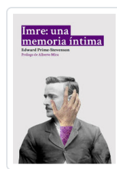
IMRE: UNA MEMORIA ÍNTIMA PRIME-STEVENSON, EDWARD