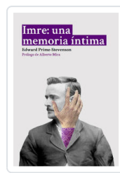
IMRE: UNA MEMORIA INTIMA PRIME-STEVENSON, EDWARD