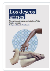
DESEOS AFINES, LOS AA.VV