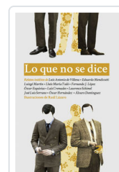
LO QUE NO SE DICE AA.VV