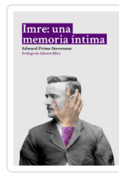
IMRE: UNA MEMORIA INTIMA PRIME-STEVENSON, EDWARD