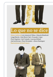
LO QUE NO SE DICE AA.VV