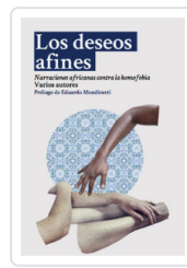
DESEOS AFINES, LOS AA.VV