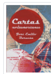
CARTAS NORTEAMERICANAS BURUCUA, JOSE E.