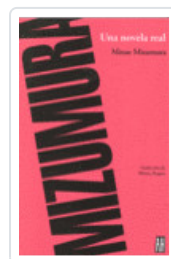
UNA NOVELA REAL MIZUMURA, MINAE