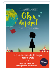
OLGA DE PAPEL - OFERTA- GNONE, ELISABETTA