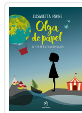
OLGA DE PAPEL GNONE, ELISABETTA