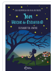
JUM HECHO DE OSCURIDAD GNONE, ELISABETTA