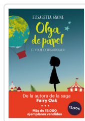
OLGA DE PAPEL - OFERTA- GNONE, ELISABETTA