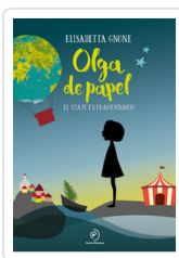
OLGA DE PAPEL GNONE, ELISABETTA