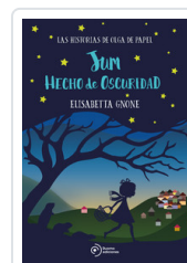
JUM HECHO DE OSCURIDAD GNONE, ELISABETTA